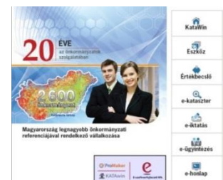
20 éve Önökért

Kérjen ingyenes bemutatót , tesztelje rendszereinket saját adataival kockázatok nélkül, kötelezettségmentesen! Megrendelés nélkül is dolgozhat éles adataival. Legyen biztos abban, hogy a legjobbat választja!